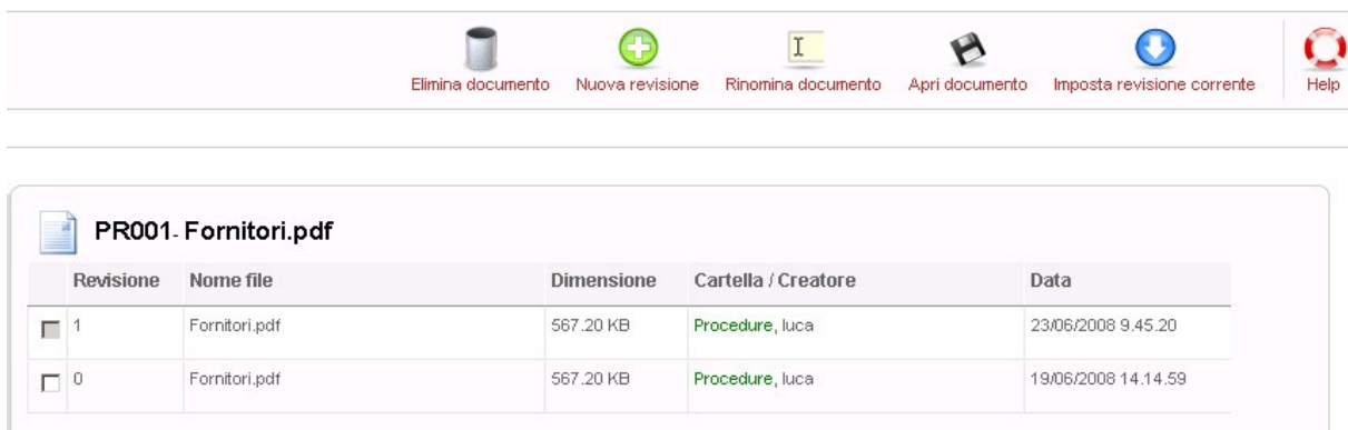
Gestione revisioni documento